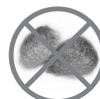
PALHA DE AÇO