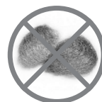
PALHA DE AÇO